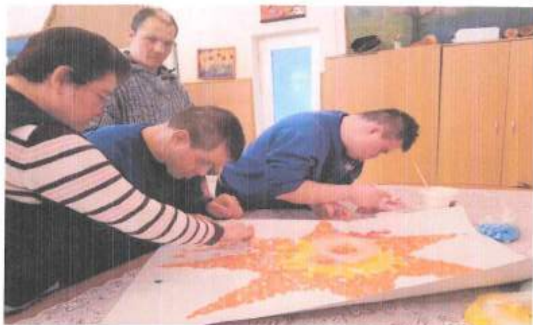
-activitati de abilitare si reabilitare