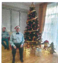
SERBARE CRACIUN 2024