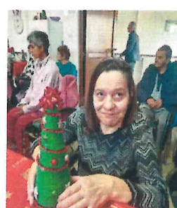
Realizare decorațiuni împreună cu beneficiarii C.I.A.P.A.D Băicoi