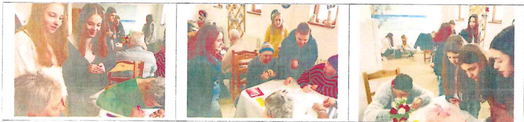
Socializare si relaxare