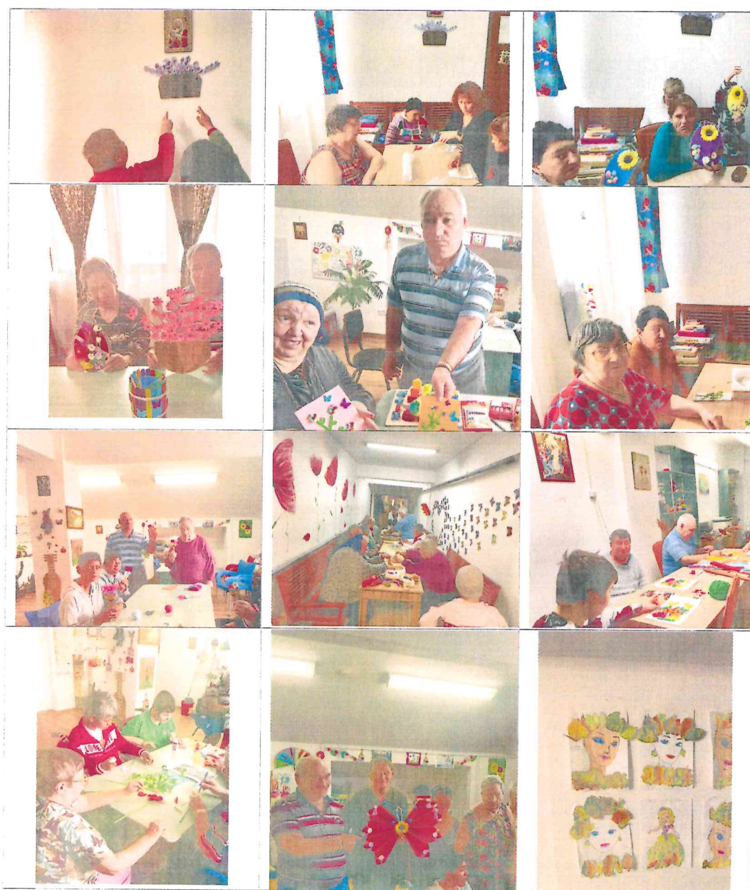
Ziua persoanelor vârstnice