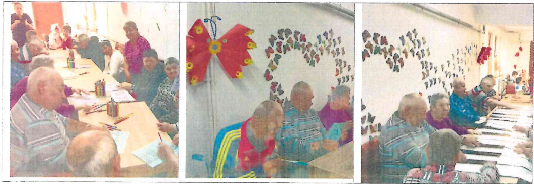
Socializarea nu cunoaste varsta